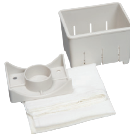
Набор для приготовления тофу