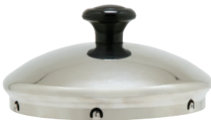
Крышка из нержавеющей стали